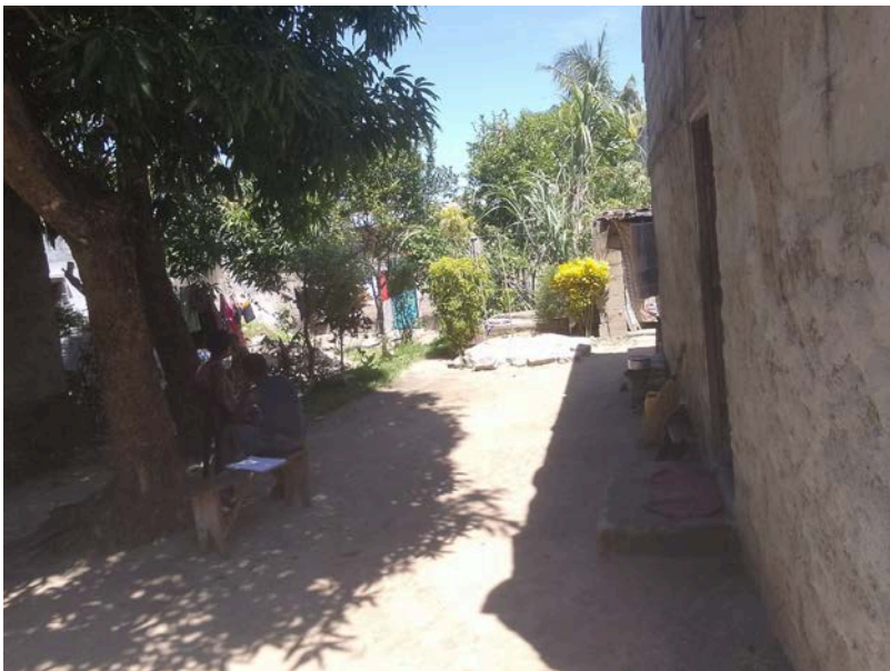
Foto da casa