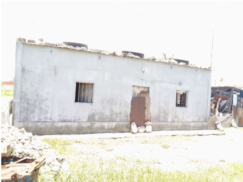
Foto da casa