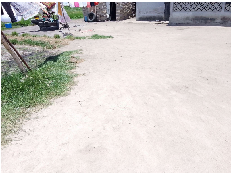
Foto da casa