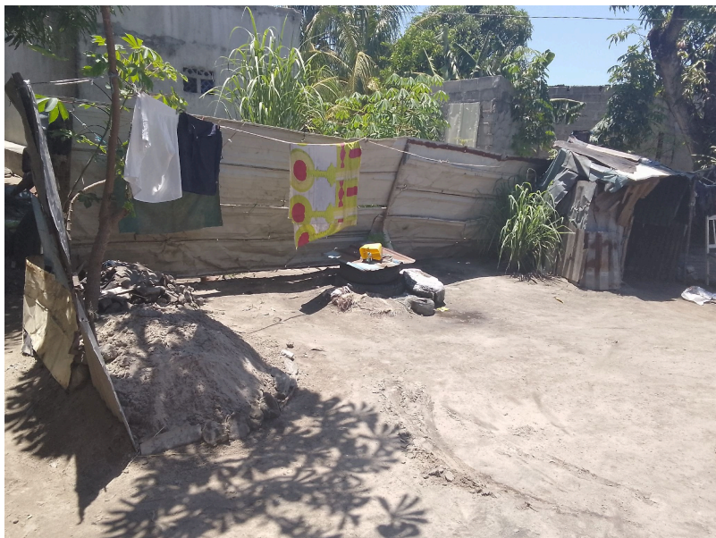
Foto da casa