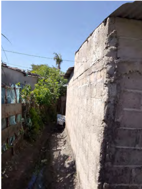
Foto da casa