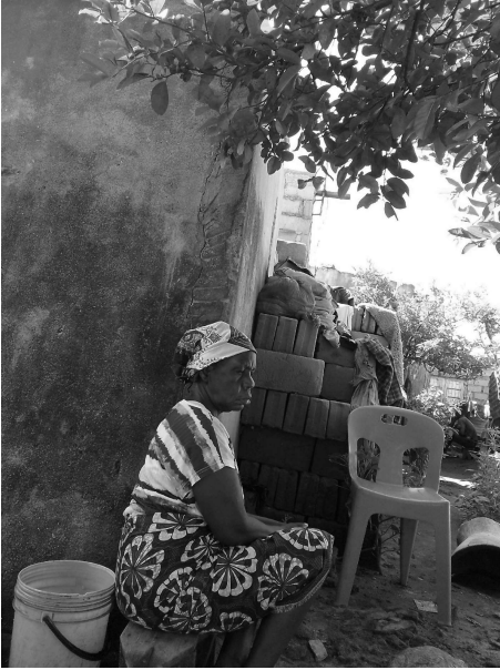
Foto da casa