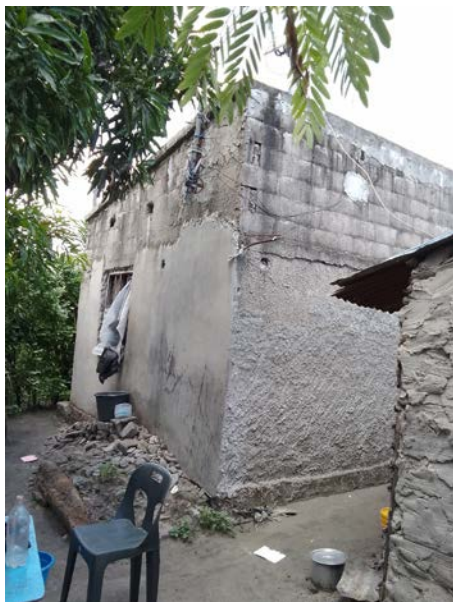
Foto da casa