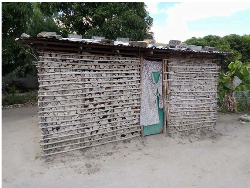
Habitação - Foto da esquina 2