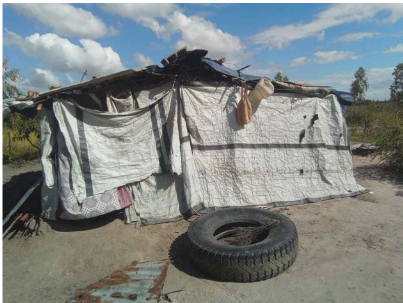
Habitação - Foto da esquina 2