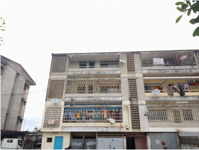
Foto da casa