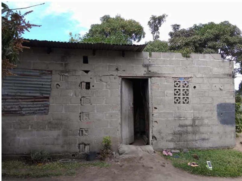
Habitação - Foto da esquina 2