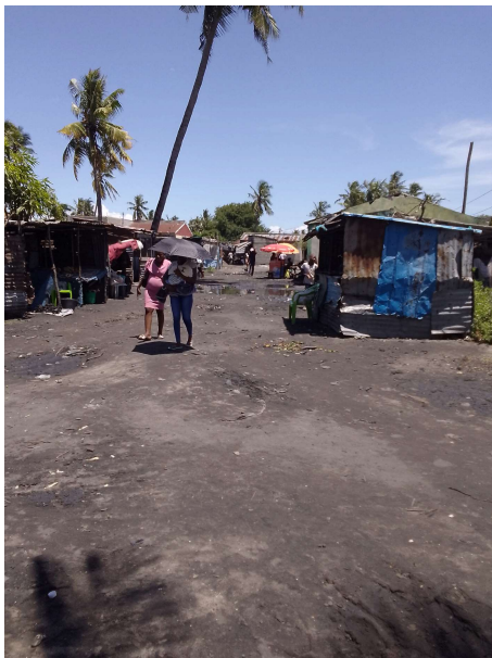
Foto do espaço livre para construção/armazém/preparação da obra