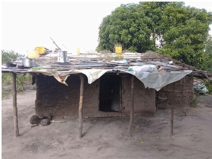
Habitação - Foto da esquina 2