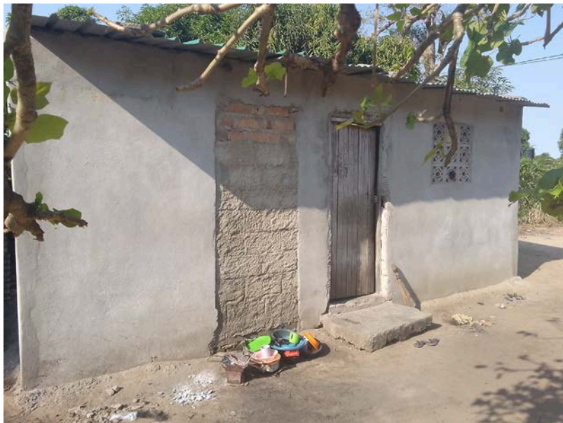
Habitação - Foto da esquina 2