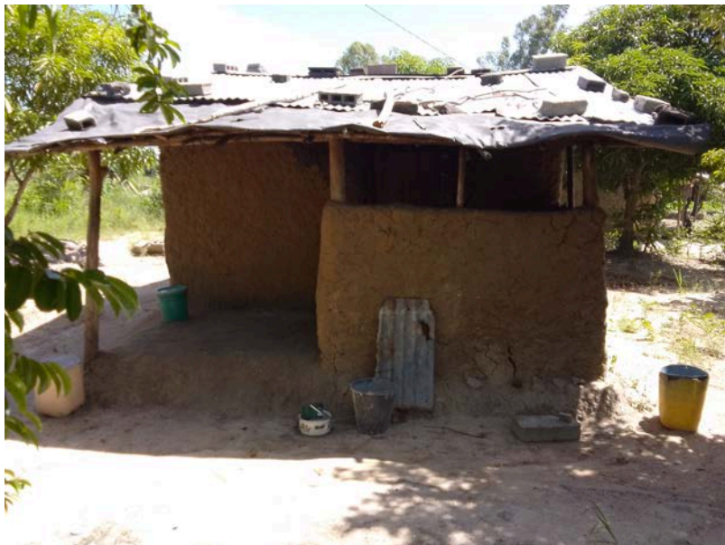
Habitação - Foto da esquina 2