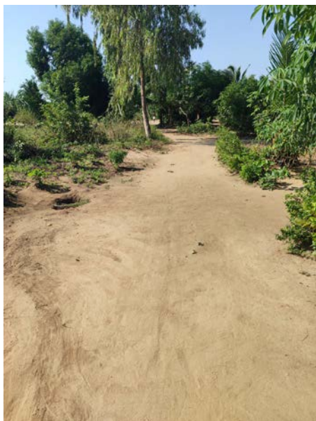
Foto do espaço livre para construção/armazém/preparação da obra