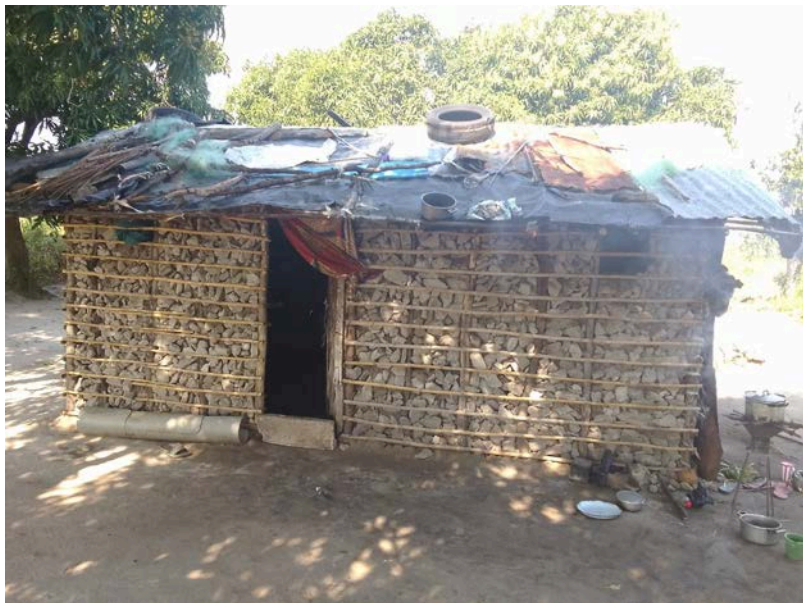
Habitação - Foto da esquina 2