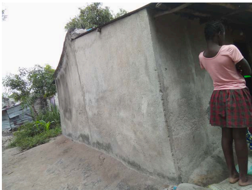
Habitação - Foto da esquina 2