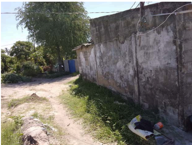
Foto da casa