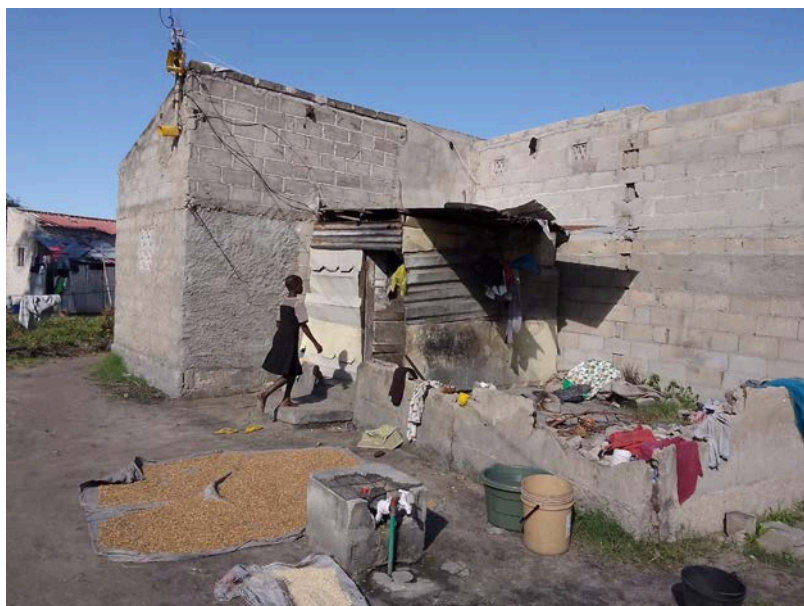
Habitação - Foto da esquina 2