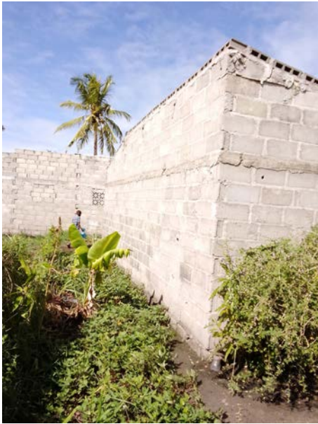
Foto da casa