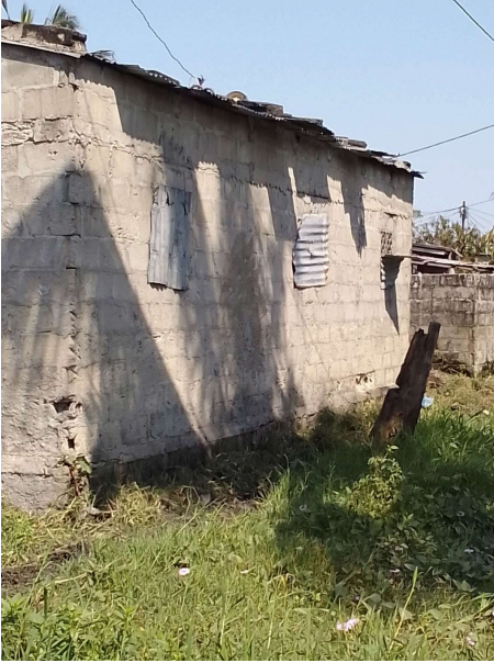
Foto da casa