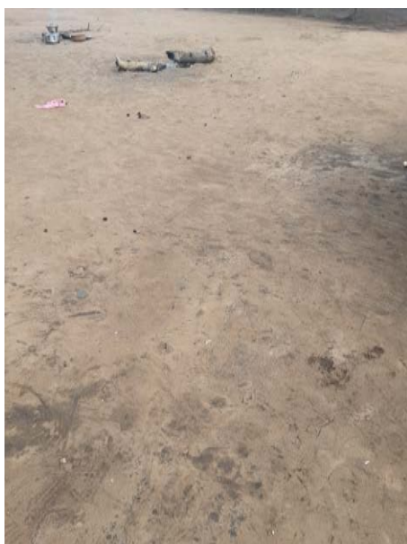
Foto do lugar onde o AF pode ficar temporariamente