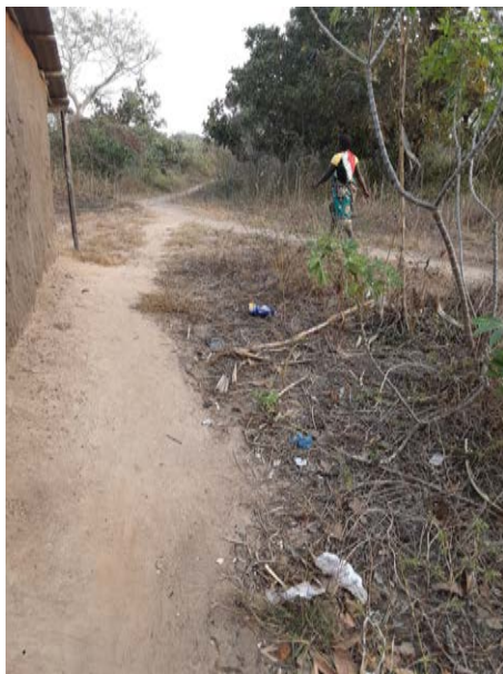
Foto do espaço livre para construção/armazém/preparação da obra