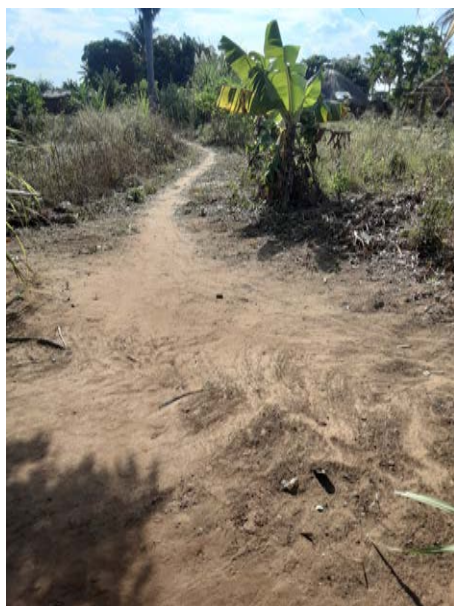
Foto do espaço livre para construção/armazém/preparação da obra