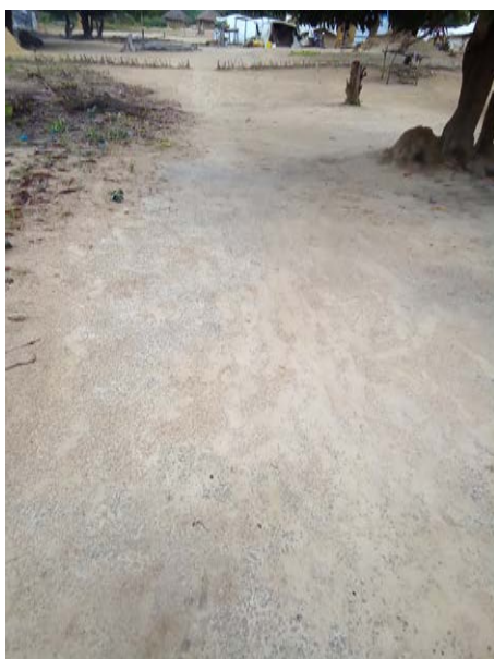
Foto do lugar onde o AF pode ficar temporariamente