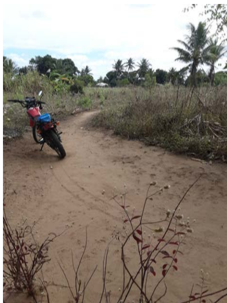
Foto do espaço livre para construção/armazém/preparação da obra