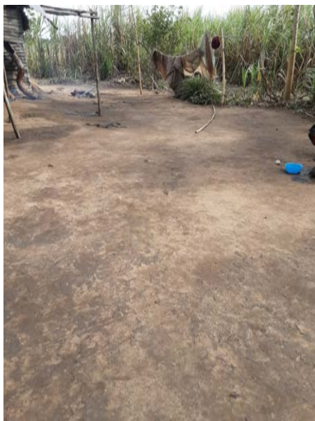
Foto do lugar onde o AF pode ficar temporariamente