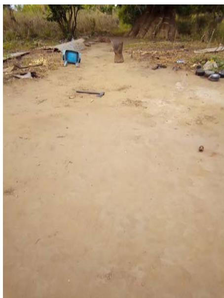
Foto do lugar onde o AF pode ficar temporariamente