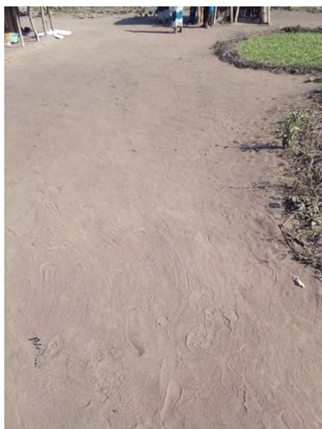
Foto do lugar onde o AF pode ficar temporariamente