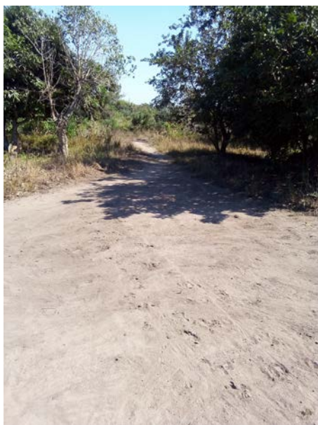
Foto do espaço livre para construção/armazém/preparação da obra