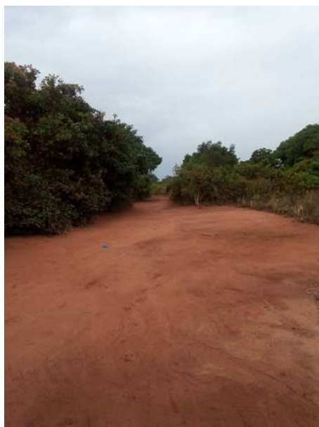
Foto do espaço livre para construção/armazém/preparação da obra