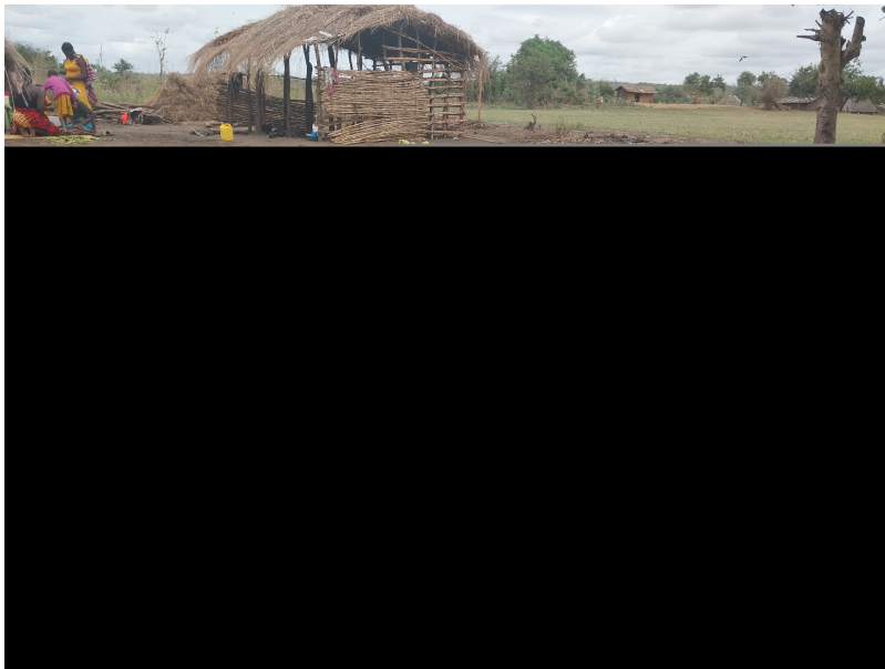
Foto do lugar onde o AF pode ficar temporariamente