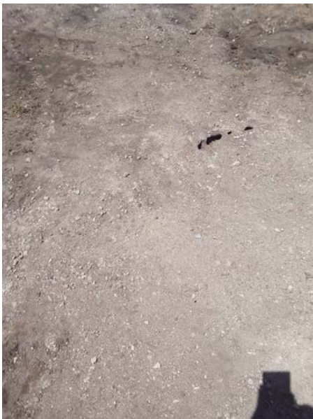
Foto da casa