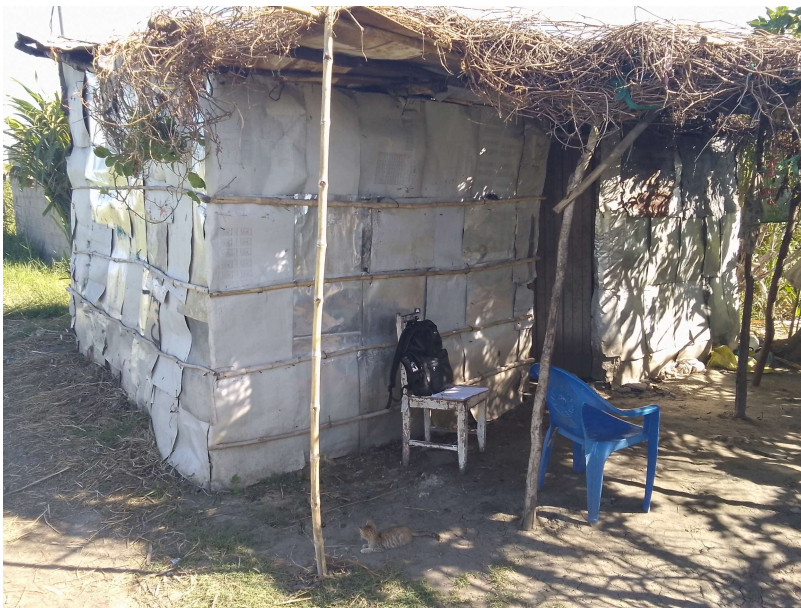
Foto do lugar onde o AF pode ficar temporariamente