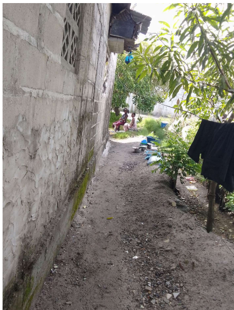
Foto da casa