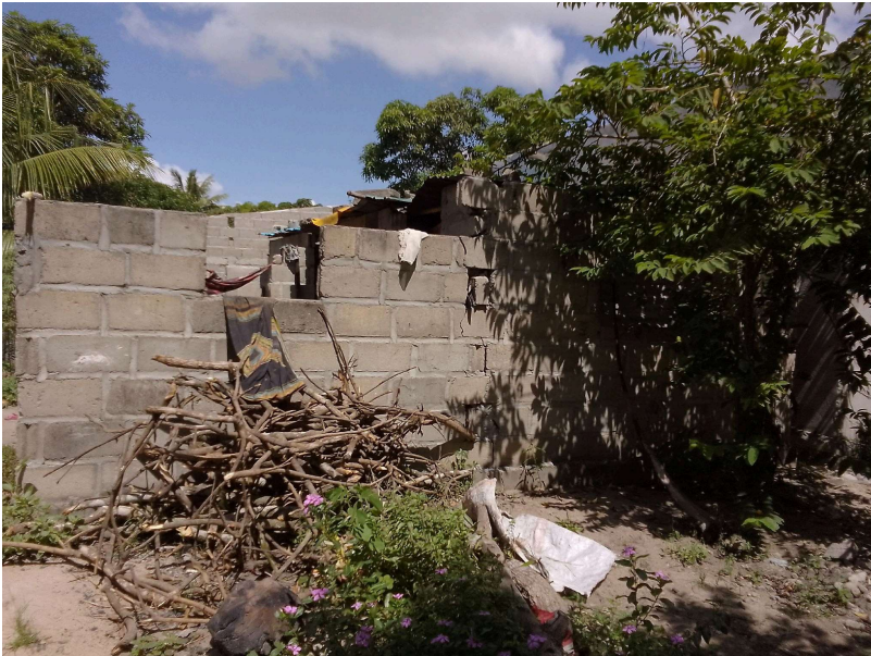
Foto da casa