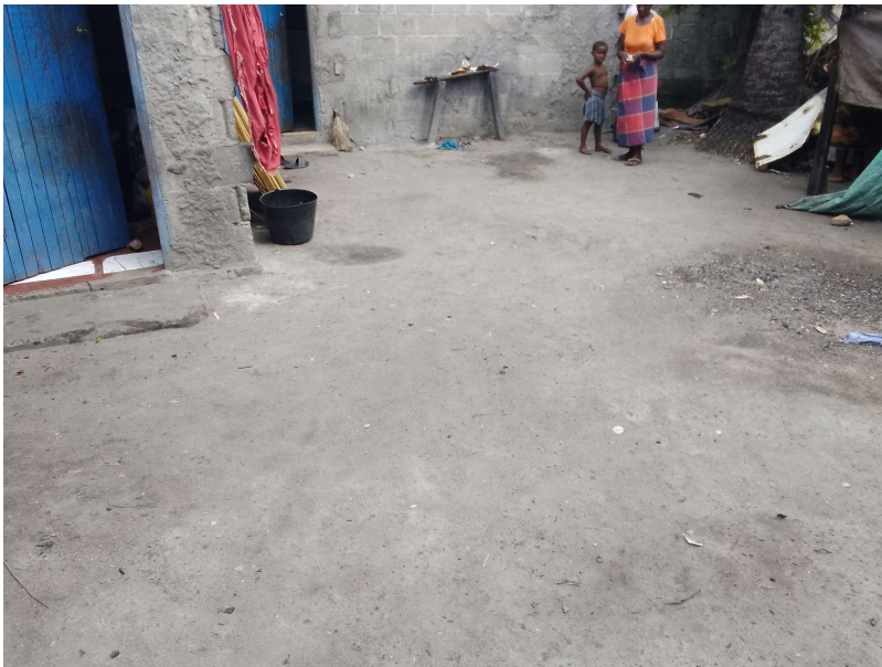
Foto do lugar onde o AF pode ficar temporariamente