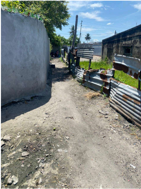
Foto do espaço livre para construção/armazém/preparação da obra