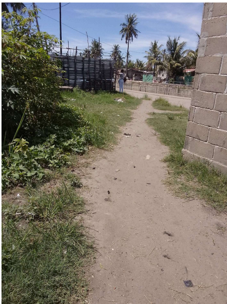
Foto do espaço livre para construção/armazém/preparação da obra