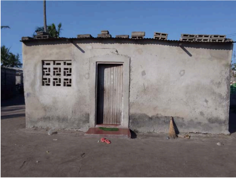
Habitação - Foto da esquina 2