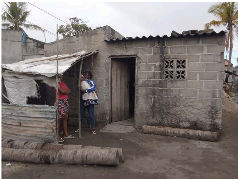
Habitação - Foto da esquina 2