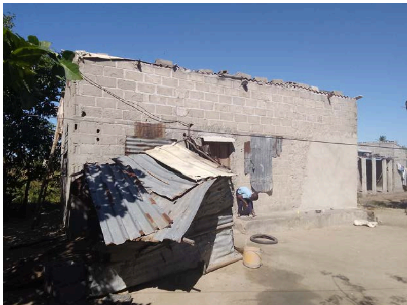
Habitação - Foto da esquina 2