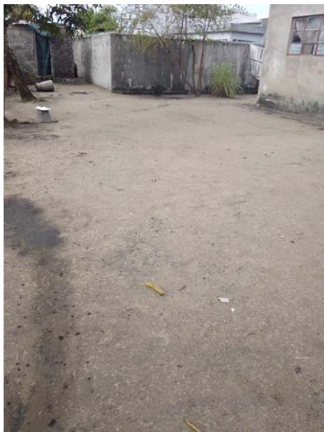
Foto do lugar onde o AF pode ficar temporariamente

Clique aqui para fazer o upload do arquivo. (<100MB)