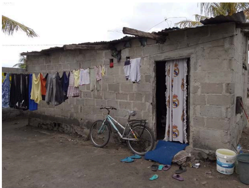
Habitação - Foto da esquina 2