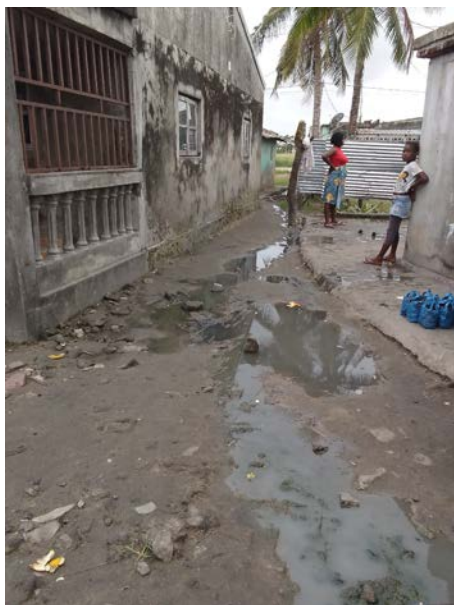
Foto do espaço livre para construção/armazém/preparação da obra