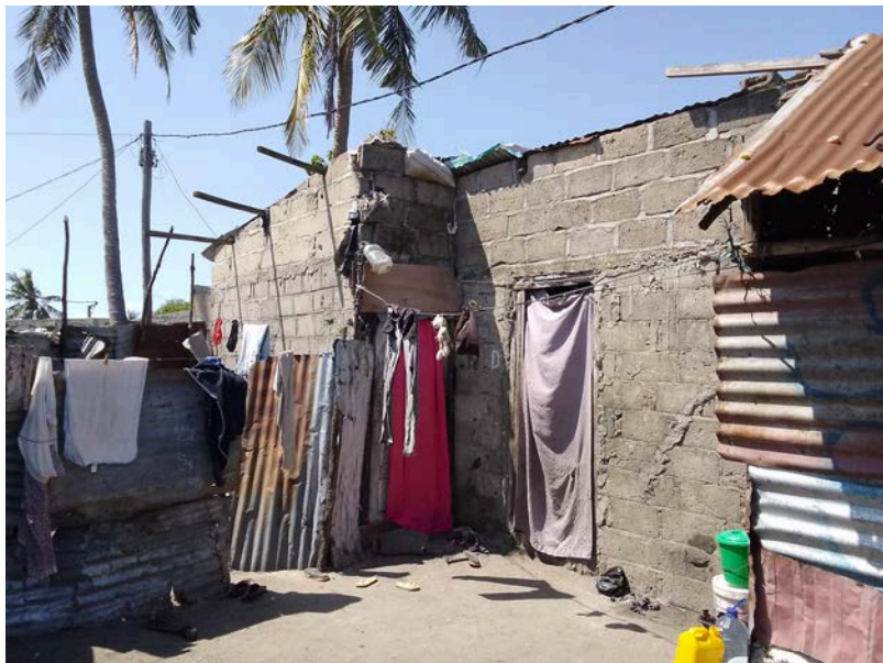
Habitação - Foto da esquina 2