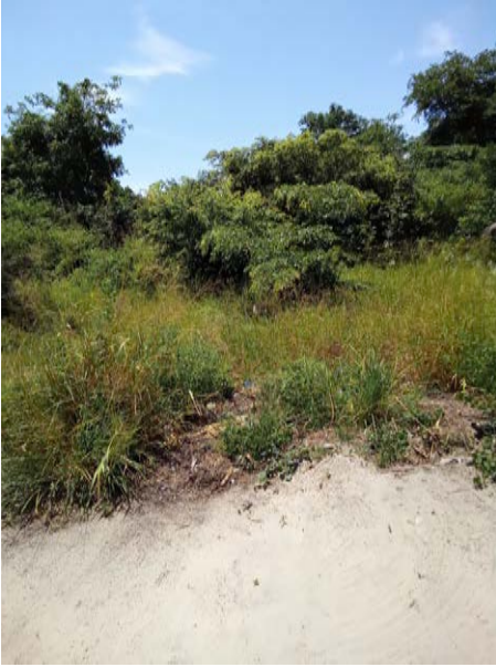
Foto da casa