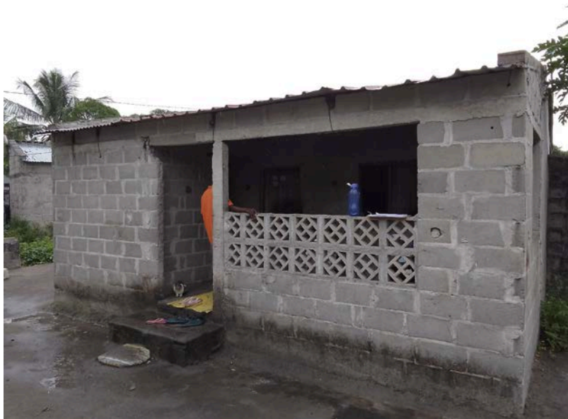
Habitação - Foto da esquina 2