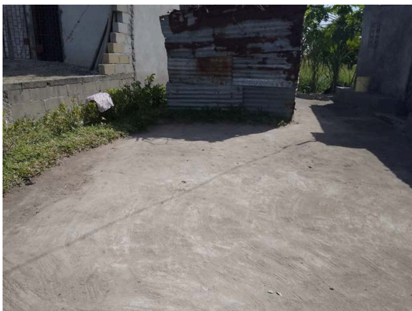
Foto do lugar onde o AF pode ficar temporariamente

Clique aqui para fazer o upload do arquivo. (<100MB)