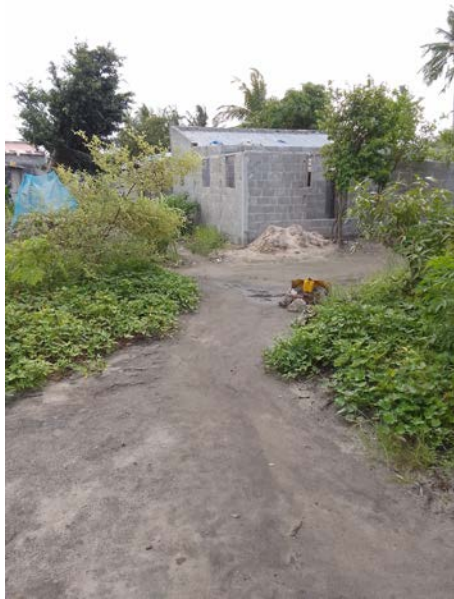
Foto do espaço livre para construção/armazém/preparação da obra